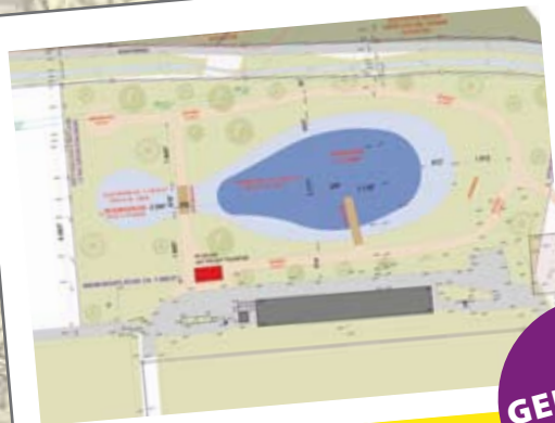
Freizeitanlage mit Beachvolleyballplatz

Die Stabile Finanzen der Gemeinde und ein privater Investor ermöglichen die Umsetzung des neuen Seniorenwohnhauses.