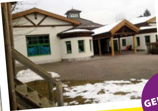
Weiterer und stetiger Ausbau der Kinderbetreuung

Diese beiden Seiten zeigen Ihnen/Euch, was wir 2009 versprochen und bis heute gehalten haben!