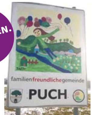
Weiterentwicklung der familien- und kinderfreundlichen Gemeinde

Unseren Lebensraum sichern & Landwirtschaft fördern sowie Festigung und Ausbau der sozialen Versorgung waren 2009 Ziele die wir versprochen und auch gehalten haben!