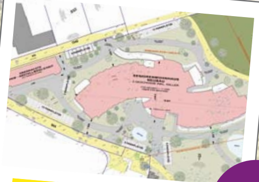
Bau des neuen Seniorenwohnhauses

Durch den Bau des neuen Ärztezentrum Puchs konnte ein 2ter Praktischer Arzt und eine Wahlärztin ihre Ordinationen ansiedeln und die Vergrößerung der Zahnarztpraxis umgesetzt werden.