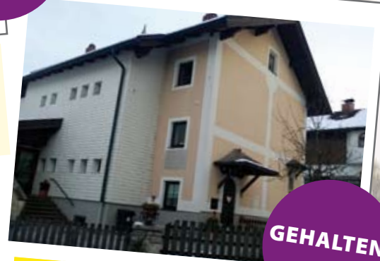
Sicherung der Volksschule St. Jakob

Die neuen Förderrichtlinien für alternative Energieformen wurden auf Anregung der ÖVP beschlossen.