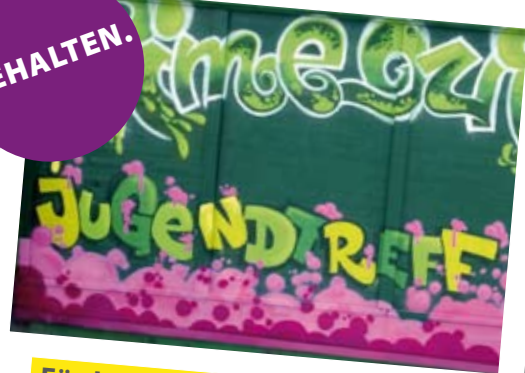
Förderung unserer Jugend und Vereine

Ein Treffpunkt für unsere Jugend sind die etablierten Vereine und der Jugendtreff. Die Anliegen der Jugend nehmen wir ernst.