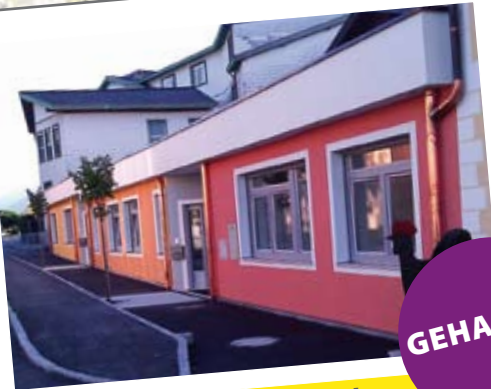
Ausbau der medizinischen Versorgung

Die Gemeinde Puch bei Hallein, mit Bgm. Helmut Klose und dem Team der ÖVP Puch , konnte in der vergangenen Amtsperiode eine Vielzahl der Wahlversprechen aus 2009 einhalten und umsetzen. FÜR UNSER PUCH ist für das Team der ÖVP Puch ein klarer Auftrag für die GemeindegängerInnen den Lebensraum stetig zu verbessern und das Moderne mit dem Traditionellen zu verbinden.